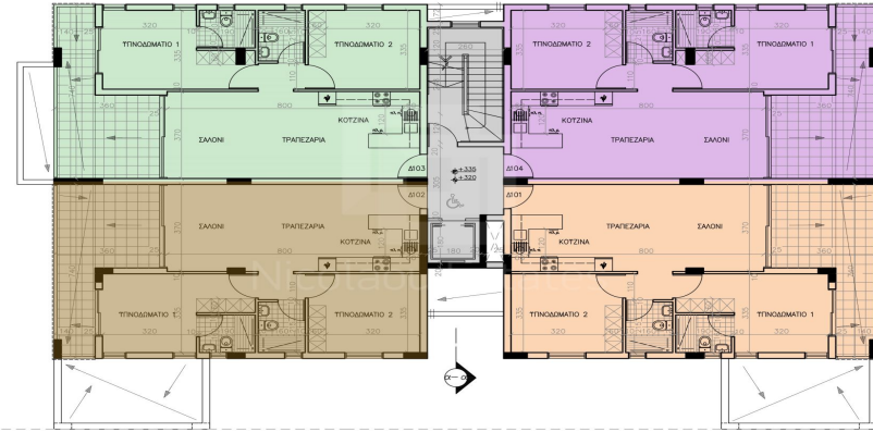
ΚΑΤΟΨΗ 1ΟΤ ΟΡΟΦΟΥ scale 1:100