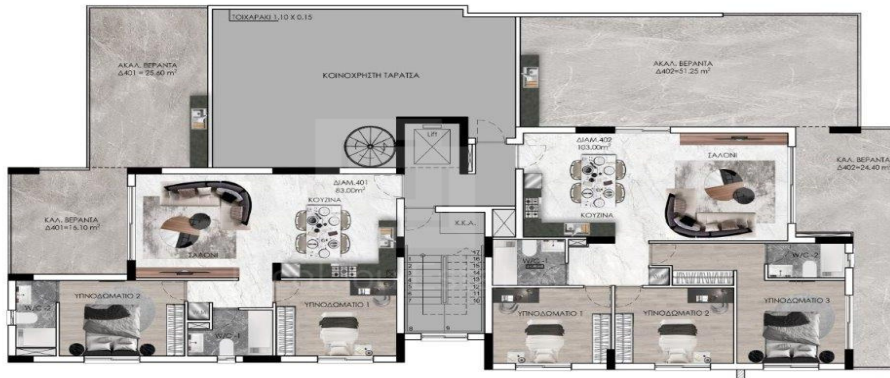
ΚΑΤΟΨΗ 4ου ΟΡΟΦΟΥ / 4th FLOOR