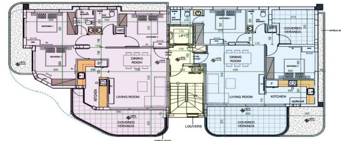
THIRD FLOOR PLAN SCALE 1:200