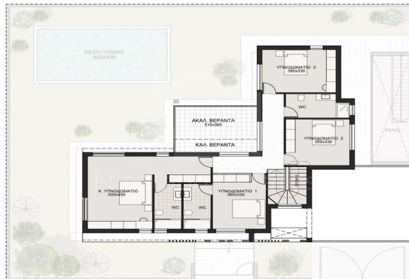
ΚΑΤΩΗ ΟΡΟΦΟΥ ΚΑΤΩΗ ΙΣΟΓΕΙΟΥ