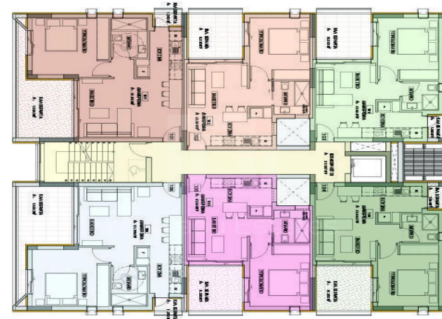
1st, 2nd & 3rd FLOORS