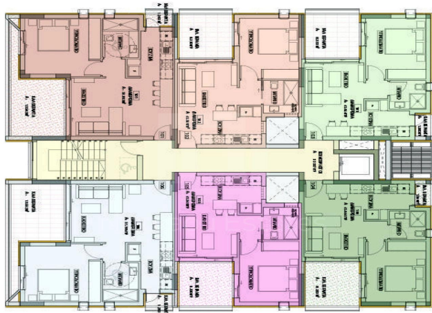
1st, 2nd & 3rd FLOORS