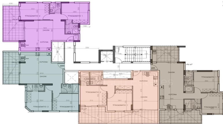
KATOHI 3OT OPOHOT scale 1:100