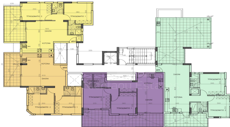
KATOHI 2OT OPOHOT scale 1:100