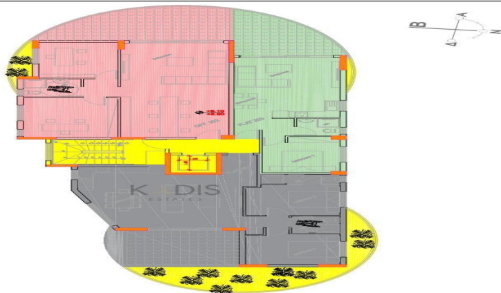
KATOPH 2OY OPOPOY