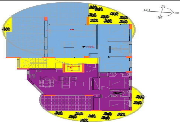
KATOPH 4OY OPOPOY